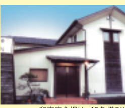
和室宴会場は、40名様OK!

☎(0875) 52-4282 営業 17:00~22:30、昼(予約) 休 不定休 P 18台