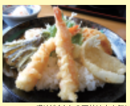
盛りだくさんの天丼は大人気!

☎(0875) 56-3228 営業 11:00~15:00、16:30~20:00 休 第3水曜日(その他水曜日は11:00~15:00) P 15台